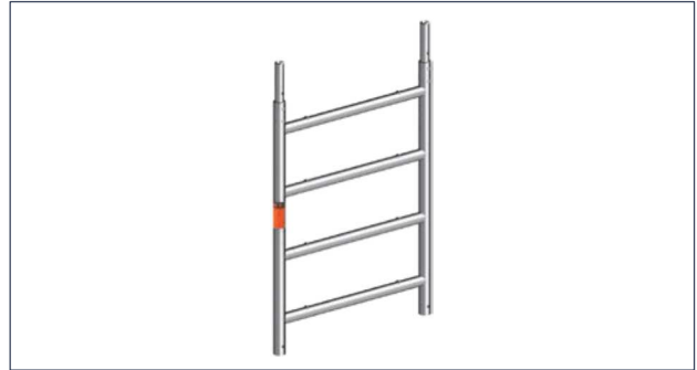
Telaio verticale 75/4 | Rif.N. 1297.004 Utilizzabile anche per i trabattelli Zifa, Uni Standard e Uni Leggero

I telai verticali del trabattello Solo sono gli stessi utilizzati anche per il trabattello Zifa, Uni Standard ed Uni Leggero.